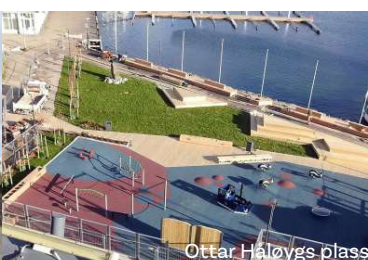
Ottar Håloygs plass