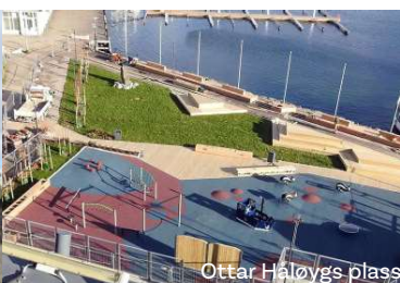
Ottar Haløys plass